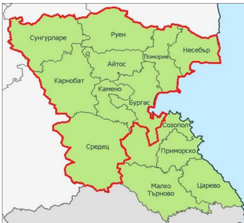
Фиг. 2. Административна карта на област Бургас с означен обхват на регион за управление на отпадъците Бургас

Община Несебър участва в Регионално сдружение за управление на отпадъците - Регион Бургас заедно с общини Бургас, Айтос, Камено, Карнобат, Несебър, Поморие, Руен и Сунгурларе. Основната цел на сдружението е изграждане на устойчива система за управление на отпадъците, която да осигурява необходимата инфраструктура за третиране, оползотворяване и екологосъобразното обезвреждане на битови в т. ч. биоразградими, опасни отпадъци от домакинствата и строителни отпадъци, генерирани на територията на региона.